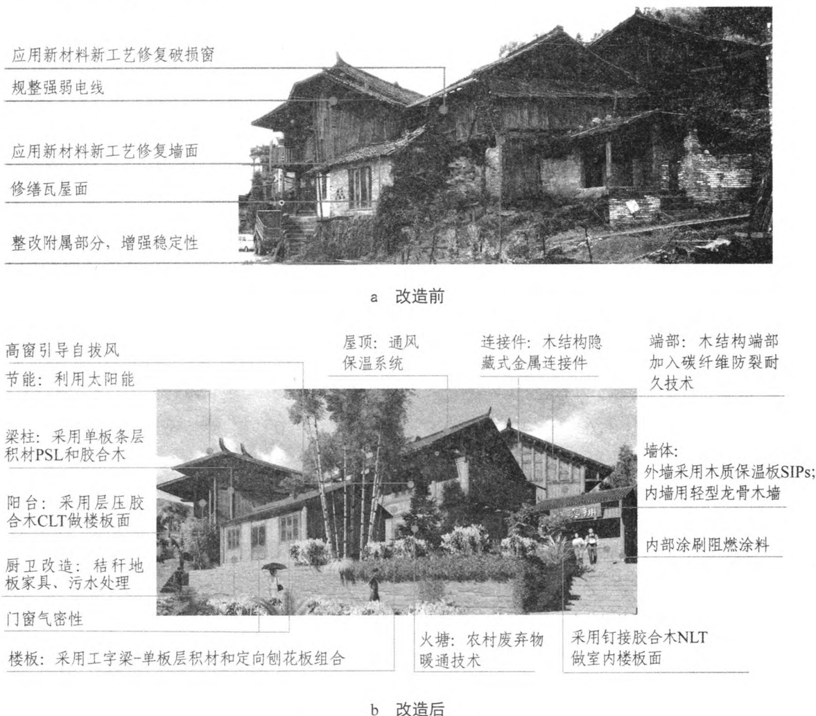
图1 改造前后的苗族吊脚楼